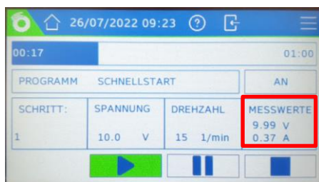
Abb.6: Werte während der Referenzmessung

Risque de blessure par inhalation de poussières, de vapeurs et de gaz. Risque de blessure et de brûlure par contact des yeux et de la peau avec le produit de traitement !