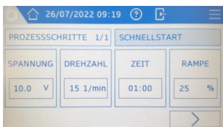
Abb.5: Parameter für Referenzmessung